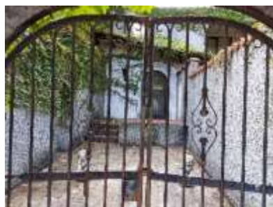
スパニッシュ建築邸

棚田康司 《僕は僕の中に薔薇を持っている》 (部分) 2022 樟の一本造りに彩色、鉛、金箔 164×53.5×51cm 撮影:宮島径 ©TANADA Koji Courtesy Mizuma Art Gallery