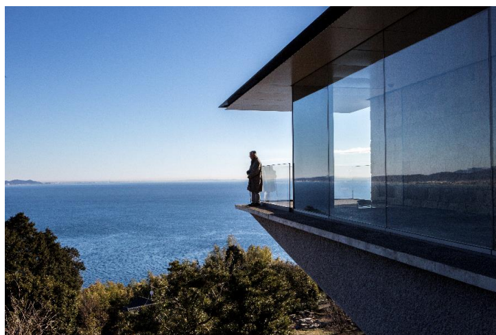
江之浦測候所 - 夏至光選擇 100メートルギャラリー先端